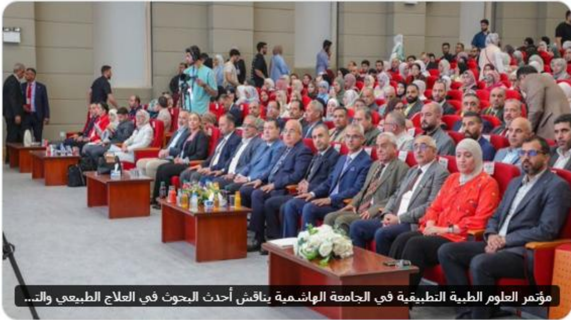
مؤتمر العلوم الطبية التطبيقية في الجامعة الهاشمية يناقش أحدث البحوث في العلاج الطبيعي والت...

مؤتمر العلوم الطبية التطبيقية في الجامعة الهاشمية يناقش أحدث البحوث في العلاج الطبيعي والتغذية السريرية والتصوير الطبي